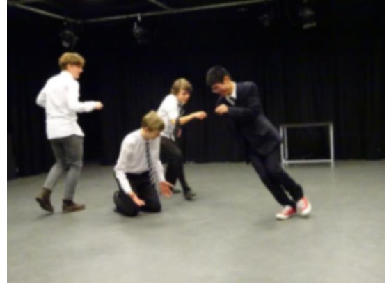
（演劇の授業の様子）