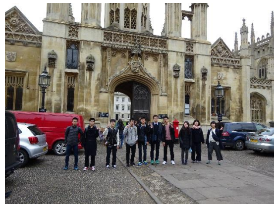
（ケンブリッジ大学）